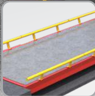
CONCRETO MODULAR CLM