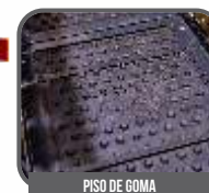
PISO DE GOMA