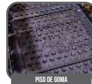
PISO DE GOMA