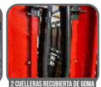
2 CUELLERAS RECUBIERTA DE GOMA