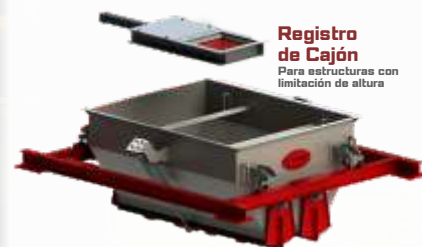
Registro de Cajón Para estructuras con limitación de altura