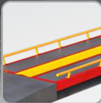
MCM - MODULAR CONCRETO METÁLICA