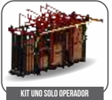
KIT UNO SOLO OPERADOR