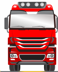
SOBRE EL PISO

Ilustraciones y datos técnicos sujetos a cambios sin previo aviso.