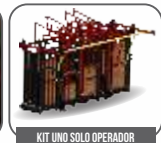
KIT UNO SOLO OPERADOR