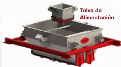
Tolva de Alimentación