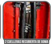
2 CUELLERAS RECUBIERTA DE GOMA