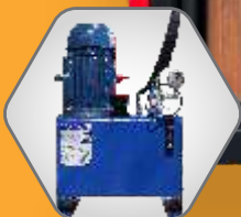
MOTOR ELÉCTRICO 3hp 220/254V MONOFÁSICO